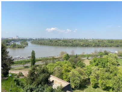
A Duna és a Száva összefolyása