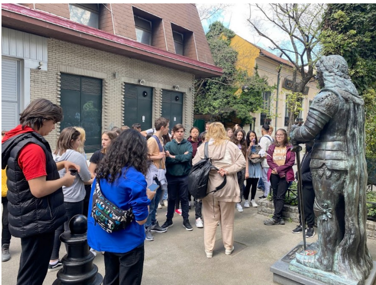
Hunyadi János szobra