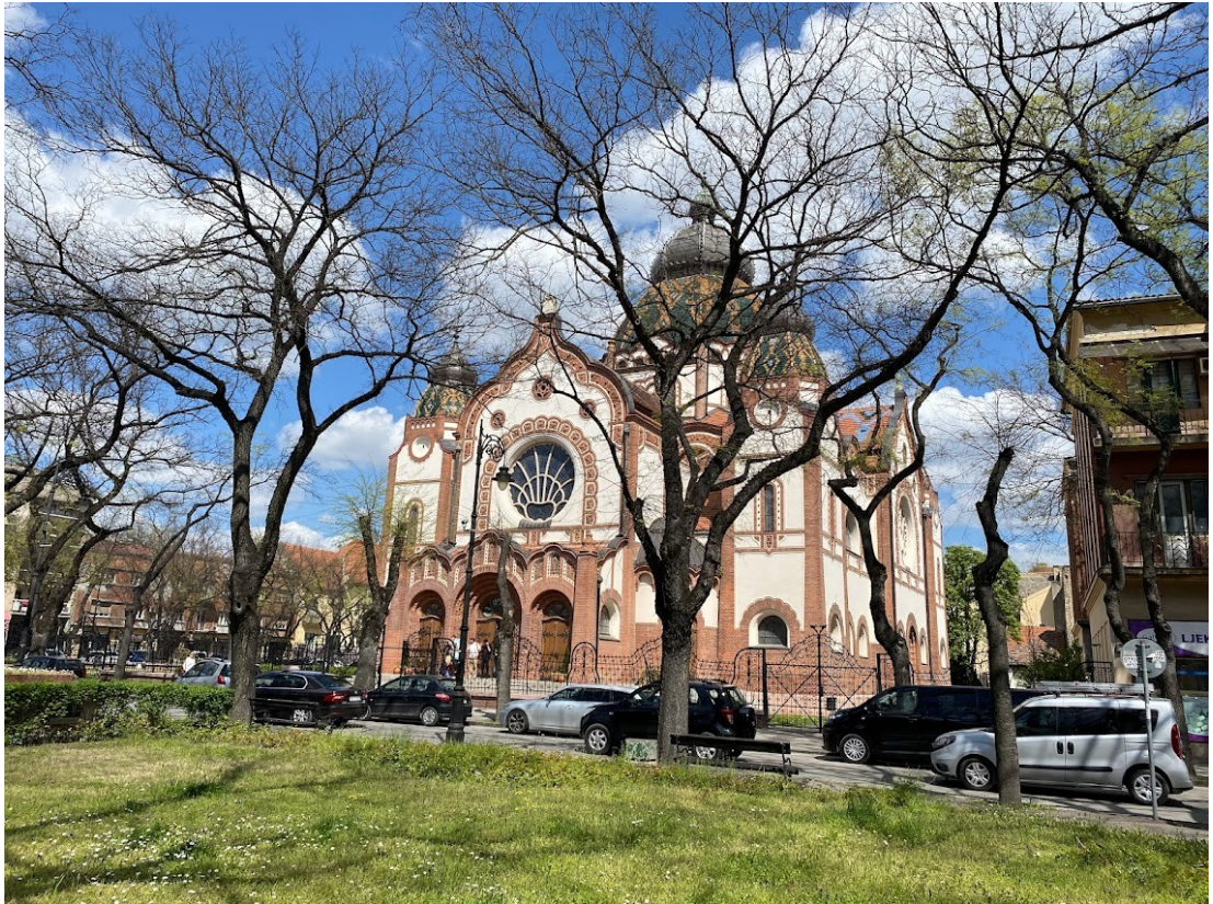
A szabadkai zsinagóga