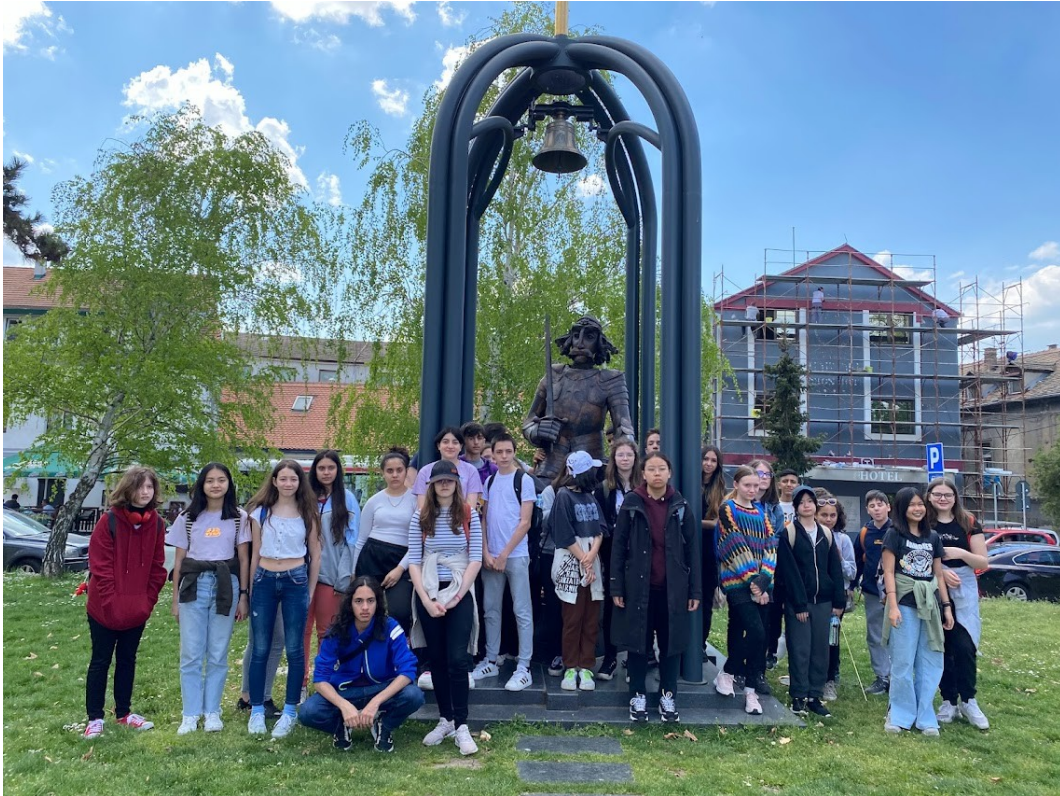
A zimonyi Hunyadi-szobor előtt a Duna-parton