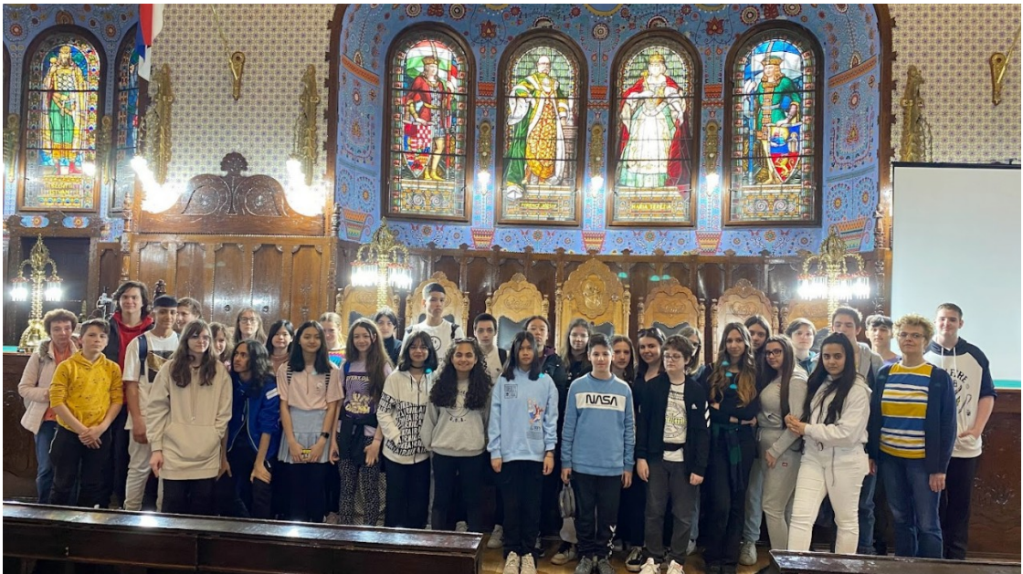
A városháza dísztermében