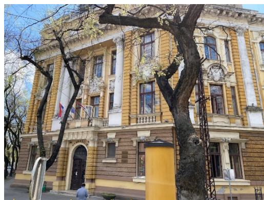
Ide járt gimnáziumba Kosztolányi Dezső