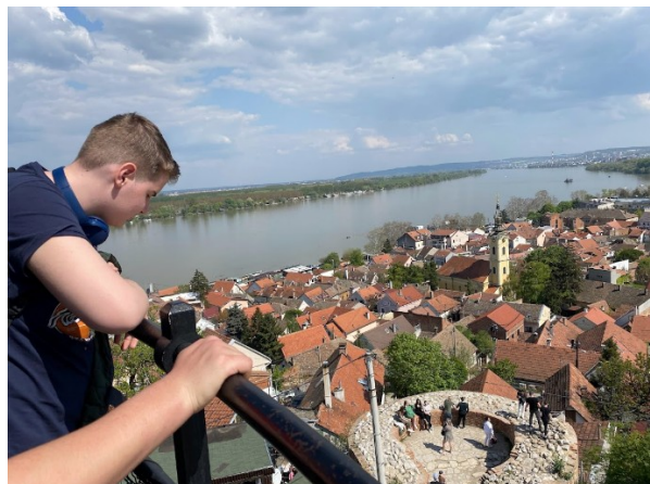
A milleniumi Hunyadi-toronynál