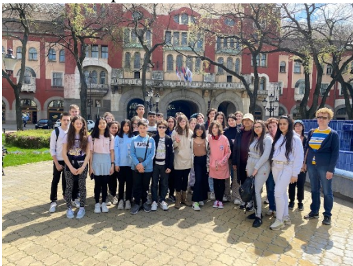
A városháza előtt