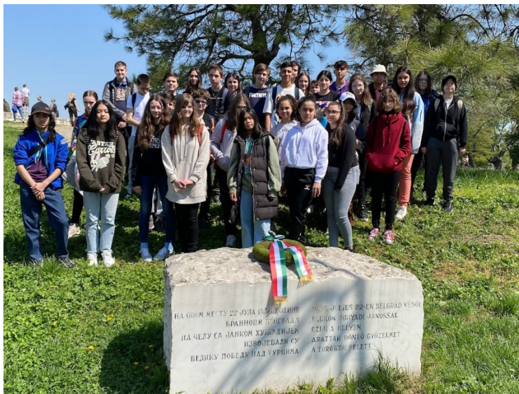
Koszorúzás a nándorfehérvári emlékműnél